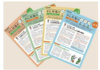
毎月最新の情報をNewsとしてお届け