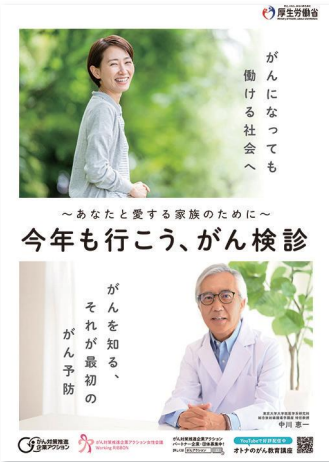
社内掲出用のポスターを無料でプレゼント

無料で、ここまでできる会社のがん対策！ 「がん対策推進企業アクション」に登録しましょう。