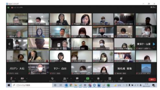
企業同士の情報交換オンライン会議の様子