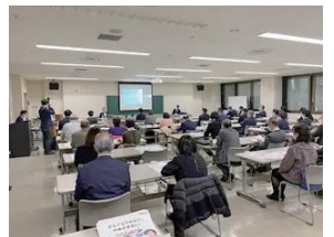
特別講師によるオンライン・オフライン無料研修